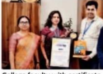
College faculty with certificate and award.