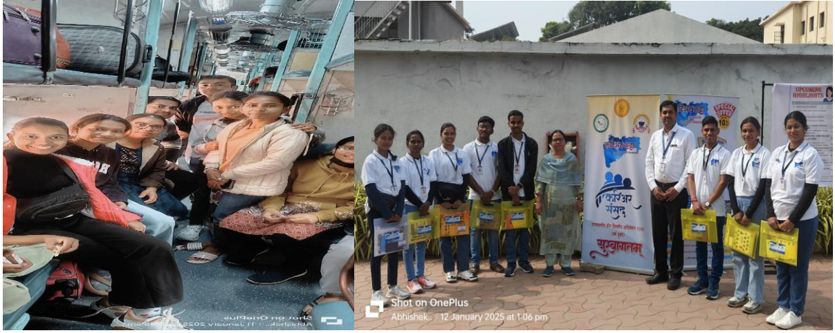
शारदाबाई पवार आर्ट्स कॉमर्स आणि विज्ञान महाविद्यालय, बारामती