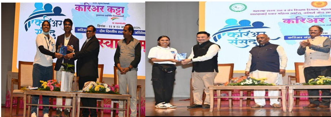
बारामती राज्यस्तरीय अधिवेशन