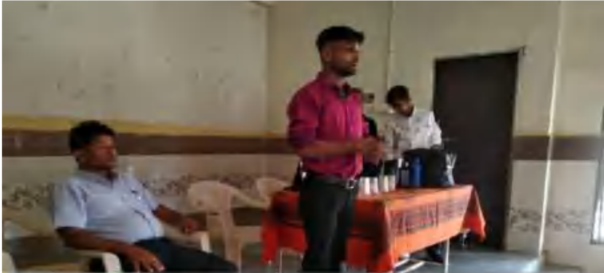
Deekshabhoomi, Nagpur, Maharashtra 440010, India Nagpur Maharashtra India 2022-03-13(Sun) 03:09(PM)