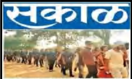
वागदरा : वागदरा विद्यापीठाच्या विद्यार्थ्यांच्या उद्घाटन कार्यक्रमाचे छायाचित्र.

या अंतर्गत नवनिर्मितीसाठी राष्ट्रीय सेवा योजनेचा निधी विविध जिल्हांतून हिण्यात येत आहे. या योजनेच्या माध्यमातून राष्ट्रीय सेवा योजनेचा निधी विविध जिल्हांतून हिण्यात येत आहे. या योजनेच्या माध्यमातून राष्ट्रीय सेवा योजनेचा निधी विविध जिल्हांतून हिण्यात येत आहे.