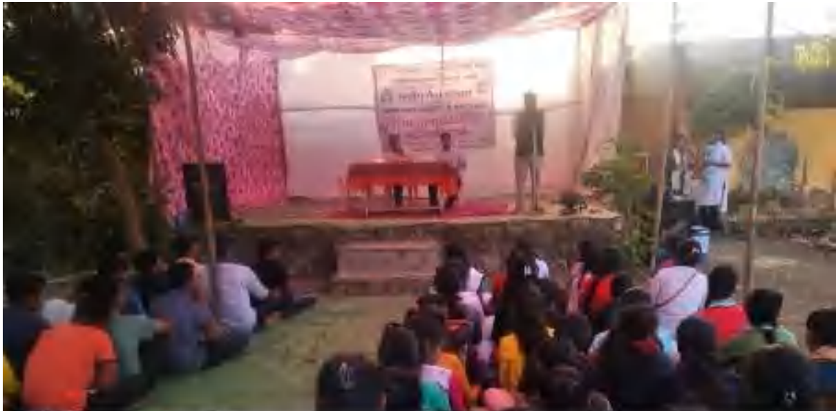
Deekshabhoomi, Nagpur, Maharashtra 440010, India Nagpur Maharashtra India 2022-03-13(Sun) 05:20(PM)